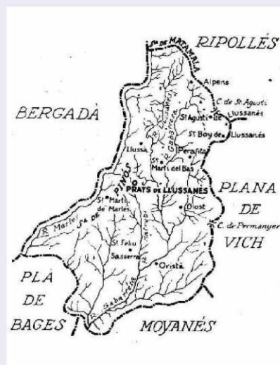
Croquis del Lluçanès. Cèsar A. Torres (Butlletí CEC, 1924). L'autor deia: «és comarca d'antic origen»